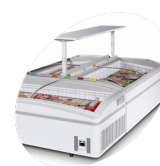
Ö-installation, hyllor som tillbehör